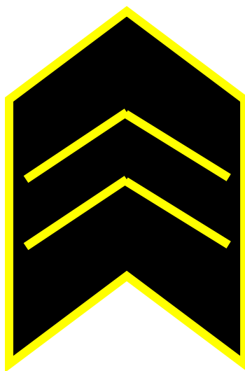
Zástupce ředitele MěP pro výkon služby