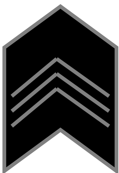
Velitel směny a velitel pořádkové jednotky